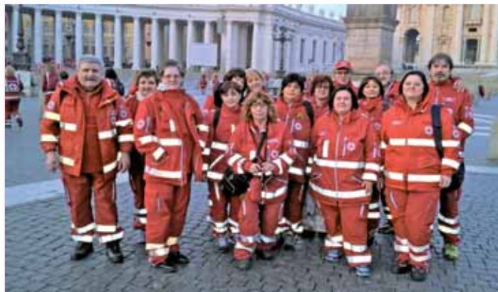
Delegazione dei Volontari CRI di Baiso in udienza dal Papa

Comitato all'udienza che Papa Francesco ha concesso alla Croce Rossa nella Sala Nervi: è stata una esperienza veramente emozionante. Il 21 marzo i nostri Istruttori hanno tenuto presso il Centro Civico una lezione sulle Manovre Salvavita Pediatriche molto partecipata. Si è da poco concluso il corso che ha formato 11 nuovi Volontari della Croce Rossa che stanno per indossare la divisa ed entrare in servizio.....ne avevamo assolutamente bisogno. Cinque nostri Volontari stanno frequentando un corso per addetti alle emergenze idrogeologiche organizzato dal Coordinamento di Protezione Civile: crediamo che vista la fragilità del nostro territorio possano rappresentare una utile risorsa. Mi rivolgo fin da ora a tutti i cittadini di Baiso per ricordare loro che terremo a gennaio il prossimo corso sperando che prendano in considerazione la possibilità di mettere a disposizione una piccola parte del loro tempo libero per questa causa, crediamo ne valga la pena, quella del Volontario è una esperienza che arricchisce, gratifica, emoziona.